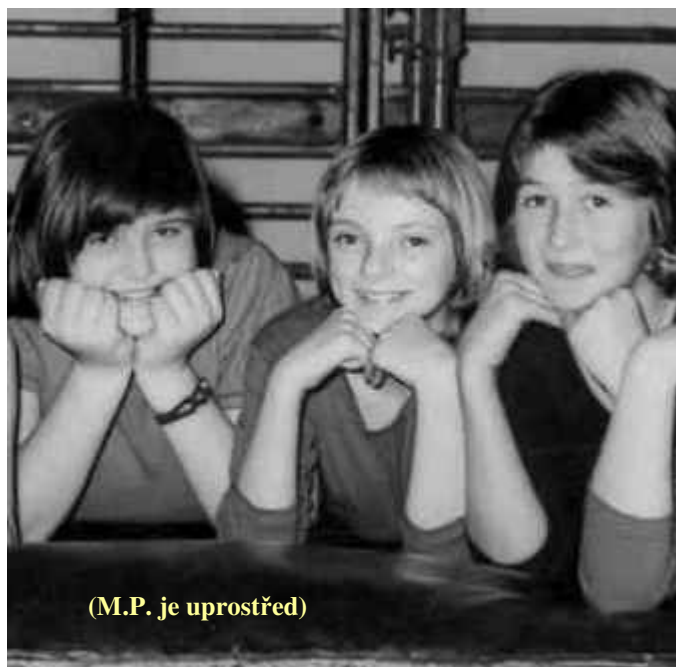
(M.P. je uprostřed)