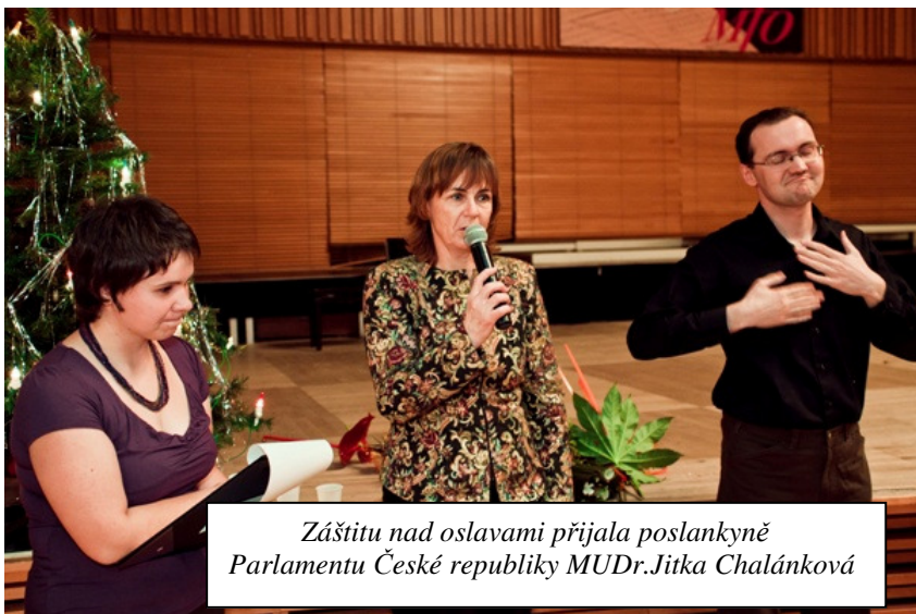
Záštitu nad oslavami přijala poslankyně Parlamentu České republiky MUDr. Jitka Chalánková