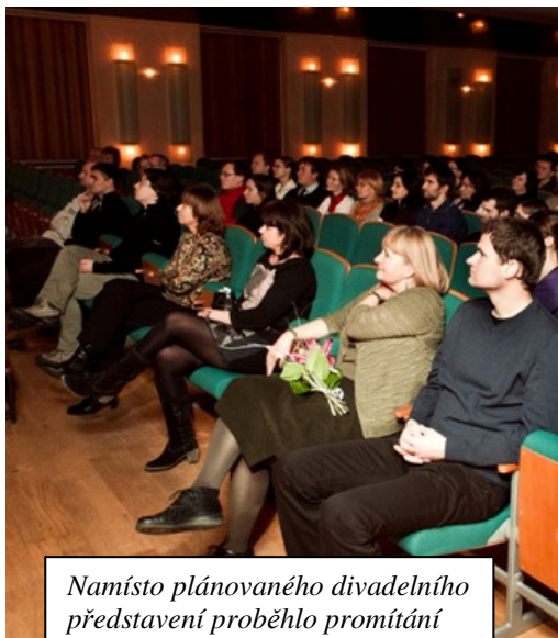
Namísto plánovaného divadelního představení proběhlo promítání dvou filmů